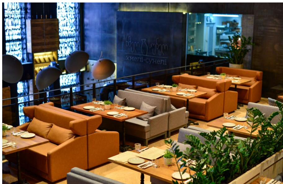
Фрагменты каменной кладки и потолочные балки создают нужный колорит

Посетители также могут провести время на террасе, что особенно актуально в теплое время года.